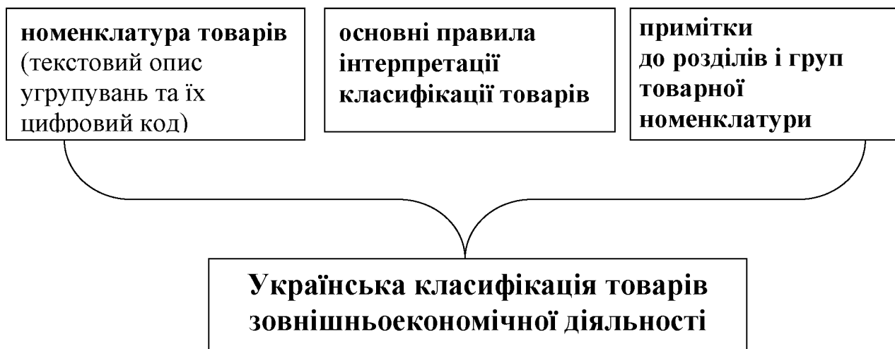
Рис. 9.1. Компонентна структура УКТЗЕД

З позиції текстового опису в УКТЗЕД товари систематизовано за розділами, групами, товарними позиціями, товарними підпозиціями, найменування і цифрові коди яких уніфіковано з Гармонізованою системою опису та кодування товарів. Для докладнішої товарної класифікації використовується сьомий, восьмий, дев'ятий та десятий знаки цифрового коду.