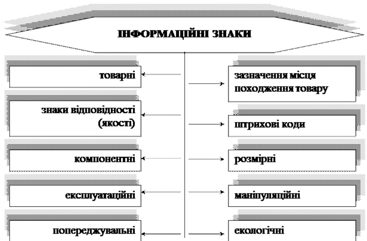
Рис. 1.2 – Класифікація інформаційних знаків

Товарний знак – позначення, за яким товари і послуги одних осіб відрізняються від однорідних товарів і послуг інших осіб.