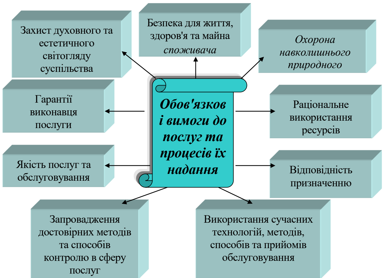
Рисунок 1.2 – Обов'язкові вимоги до послуг та процесів їх надання