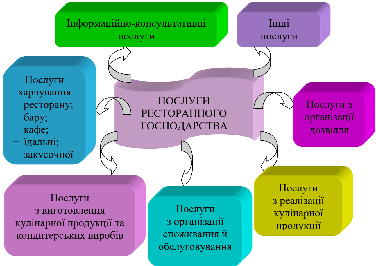
Рисунок 1.1 – Класифікація послуг ресторанного господарства

Класифікація послуг, що надаються споживачам у закладах ресторанного господарства, наведена на рис. 1.1.